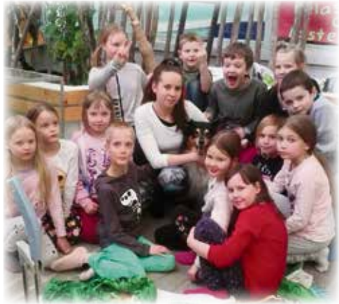
Lemmikkikerholaiset keväällä 2018.

4H on mukana järjestämässä monia lasten ja perheiden tapahtumia Uuraisilla yhteistyössä monien eri tahojen kanssa. Esimerkiksi Iltakirjasto, Kierrätyspäivä, Summerparty, Metsäpäivät ja elokuvaillat ovat jo muodostuneet perinteeksi.